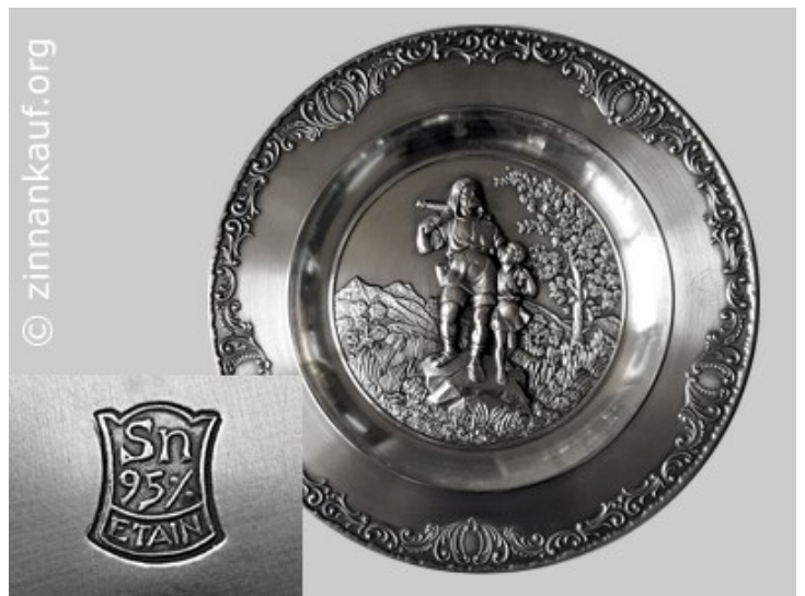
Muster | Zinnteller 70er Jahre