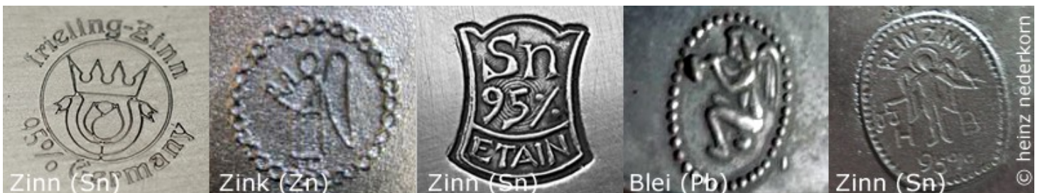
Diverse Marken und Stempel mit und ohne "Zinn-Engel"