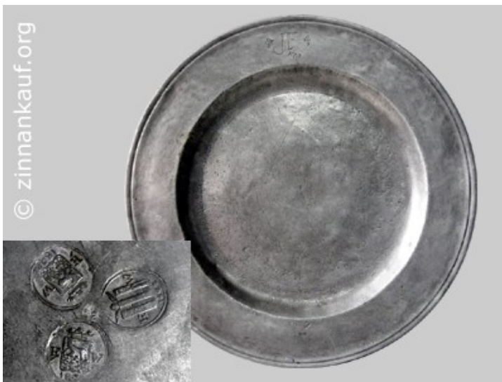
Muster | Zinnteller um 1900

Diese Methode beruht auf der Eigenschaft von Blei, beim Abrieb auf weißem Papier einen deutlich sichtbaren dunklen Strich zu hinterlassen. Entsprechend dem Bleigehalt, fällt der Strich dicker oder schwächer aus. Reines Zinn hinterlässt keine Spur. Eine solche Methode kann nur einen groben Anhaltspunkt bieten.